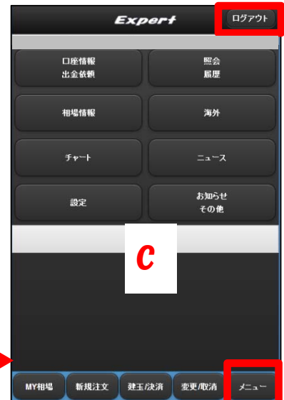
C 基本のメニュー画面